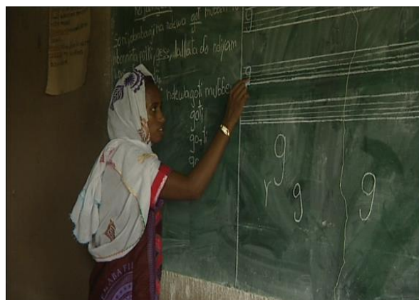
Séquence du film sur l'Education des populations pastorales

- 'L'alphabétisation en langue pular' de Marie-Eve Humery - 'La modernisation des Daaras' (écoles coraniques) de Clothilde Hugon - 'Le temps scolaire' de Fatou Niang